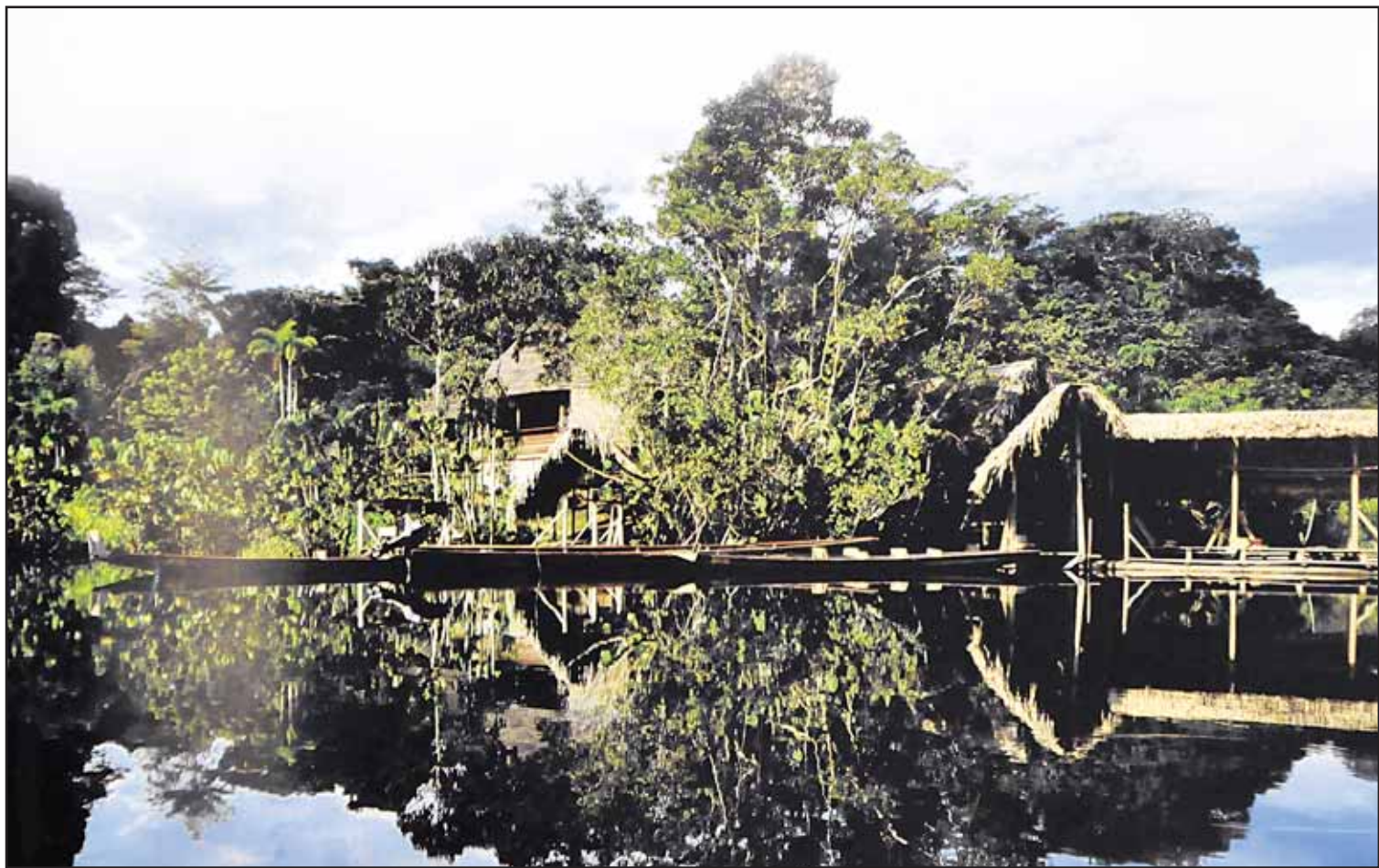
Réserve mondiale pour la biodiversité selon l'Unesco, le parc naturel Yasuni est menacé par des projets d'extraction de pétrole. ICARE

Une proposition qui peut sembler prendre la forme du chantage, mais qui reflète une logique implacable. «Ce projet veut surtout communiquer une nouvelle éthique et un nouveau mécanisme d'équilibrage dans l'accès aux ressources. Nous considérons que ce pétrole, tout comme notre diversité naturelle et culturelle, est un bien public com-