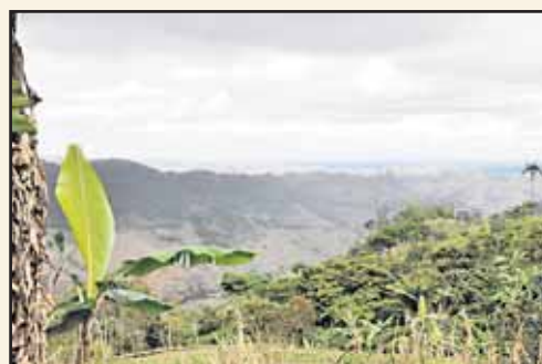
Une grande partie du pays est déjà déforestée, pour l'agriculture ou la construction. ICARE

En ce sens , le projet Yasuni-ITT est cohérent. Mais il est surtout nouveau par son ton et sa détermination. Accepter ce projet et le financer ouvriraient une brèche dans la politique internationale pour d'autres réclamations.